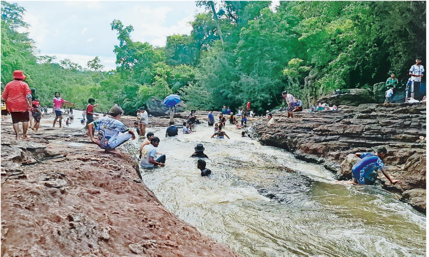
เย็นสดชื่น นักท่องเที่ยวแห่สัมผัสธรรมชาติและเล่นน้ำคลายร้อนที่ลานน้ำตกหินตั้ง เขตป่าสงวนแห่งชาติป่าห่มเกล้า บ.โนนสว่าง ต.กุศหมากไฟ อ.หนองบัวซอ จ.อุดรธานี ซึ่งเป็นป่าดิบแล้งบนเทือกเขาภูพานน้อย โดย จนท.กรมป่าไม้คอยดูแลอย่างใกล้ชิด.