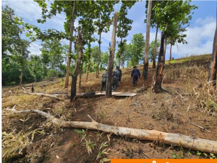
📍 ประทีป นันทะพาน 📅 18 มิถุนายน, 2024