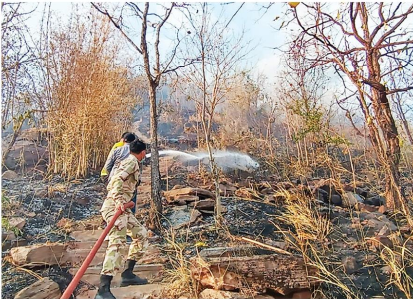
☒ ดับไฟป่า - จนท.ระดมดับไฟป่าด้านหลังวัดป่าเขาเม่าค่า หมู่บ้านเม่าค่า ต.โคกกระชาย อ.ครบุรี จ.นครราชสีมา คาดเกิดจากคนไปหาของป่าแล้วจุดไฟจมนรกลาม เมื่อ 13 ก.พ.

133.4 ไมโครกรัมต่อลูกบาศก์เมตร (มก./ลบ.ม.) รองลงมา จ.สมุทรสาคร 126.4 มก. จ.ราชบุรี 105.3 มก. จ.นครปฐม 100.1 มก. จ.เพชรบุรี 99.3 มก. โดย 24 จังหวัด พบค่าฝุ่นในระดับสีแดง ส่วนอีก 31 จังหวัดที่ยังคงมีคุณภาพที่เริ่มมีผลกระทบต่อสุขภาพ และหลายพื้นที่คุณภาพอากาศที่ยังคงอยู่ในระดับสีส้มต่อเนื่อง โดยเฉพาะภาคตะวันออกเฉียงเหนือ