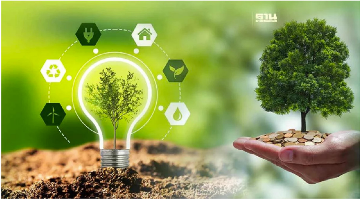
การส่งเสริม “คาร์บอนเครดิต” (Carbon Credit)

โครงการสนับสนุนชุมชนให้ดูแลป่าและวัดการกักเก็บคาร์บอน จะสร้างรายได้ให้ชุมชนจากการขายคาร์บอนเครดิต ผู้บริจาคภาคเอกชนจะสนับสนุนเงินทุนสำหรับกิจกรรมพัฒนาและการจัดการป่าไม้ พร้อมบ่มเพาะความคิดริเริ่มทางธุรกิจในท้องถิ่นแทนการจ่ายเงินเพื่อซื้อคาร์บอนเครดิตเพียงอย่างเดียว