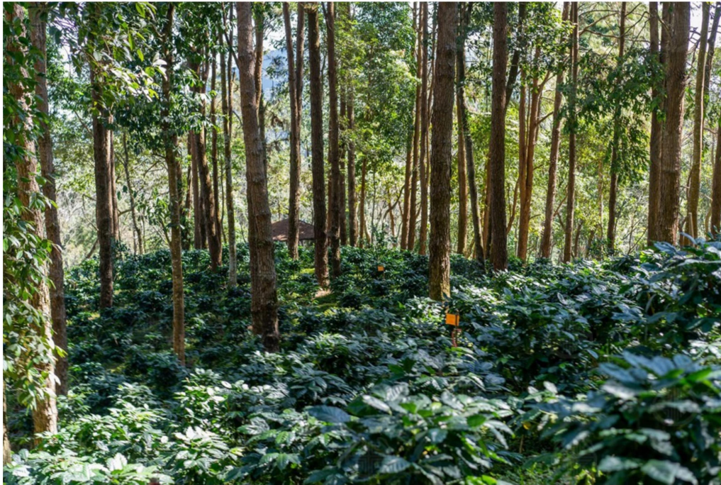
การส่งเสริม “คาร์บอนเครดิต” (Carbon Credit) บนพื้นที่ป่าชุมชน มูลนิธิแม่ฟ้าหลวงฯ

รวมทั้งตั้งกองทุนดูแลป่า สนับสนุนให้ชุมชนสร้างแนวกันไฟ และจัดเวรยามลาดตระเวนป้องกันไฟป่า ช่วยลดพื้นที่ที่ถูกทำลายจากไฟป่าจากค่าเฉลี่ย 4,638 ไร่ ลดลงเหลือ 2,300 ไร่ ระหว่างปี 2564-2565 ล่าสุดในปี 2565 ที่ผ่านมา มีพื้นที่ป่าเกิดไฟป่าเพียง 1,225 ไร่ ลดลงมากถึง 17.24% หลังจากทำโครงการมา 2 ปี