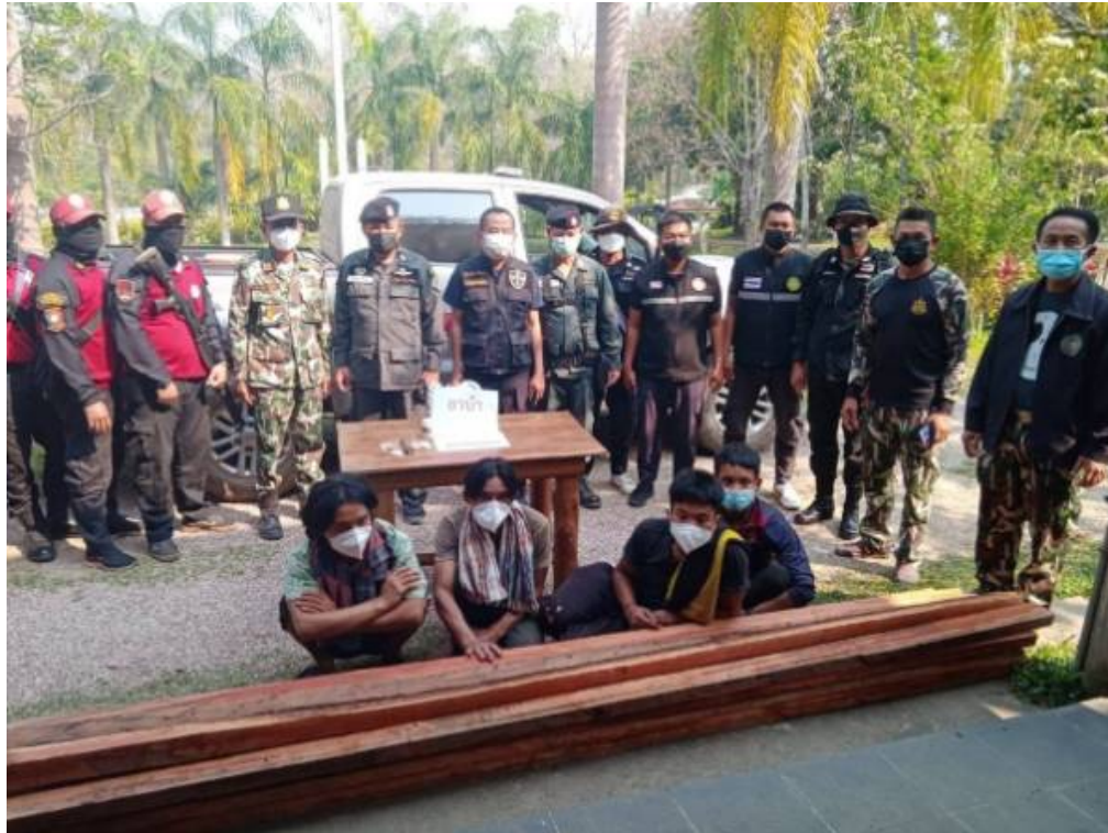
ป่าไม้สนธิกำลัง ทหาร ตำรวจ บุกจับกุมมอดไม้ชาวพม่า 4 คน พร้อมของกลาง ไม้กระยาเลย 25 ท่อนและยาบ้า 157 เม็ด กลางป่าชายแดน จ.ตาก