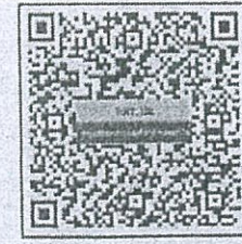
แบบฟอร์มรายงานตัวชี้วัดกรมป่าไม้ https://shorturl.asia/qNivS