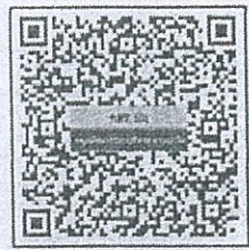
แบบฟอร์มสำหรับหน่วยงานส่วนกลาง https://shorturl.asia/KVDb0