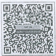
เล่มคู่มือตัวชี้วัดฯ P2567 https://www.shorturl.asia/BYkNA