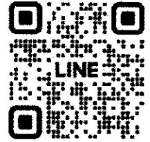
สแกน QR-CODE : LINE มูลนิธิสถานฝึกสร้างปัญญา