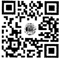
สแกน QR-CODE เพื่อดูมูลนิธิสถานฝึกสร้างปัญญา