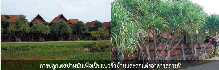
การปลูกเตยปาดันเพื่อเป็นแนวรั้วบ้านและตกแต่งอาคารสถานที่