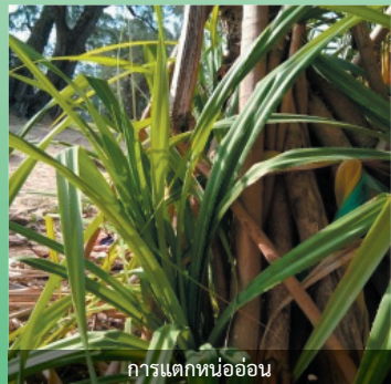
การแตกหน่ออ่อน

การขยายพันธุ์ : โดยการเพาะเมล็ดซึ่งต้องใช้ระยะเวลานานหลายปี และการแยกหน่อ (ทำได้ในปีที่ 2) สามารถเจริญเติบโตได้ดีในดินเหนียวปนทรายที่อุ้มน้ำ ชอบแสงแดด