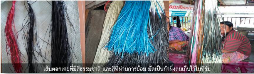
เส้นตอกเตยที่มีสีธรรมชาติ และสีที่ผ่านการย้อม มีดเป็นกำฝึงลมเก็บไว้ในที่ร่ม